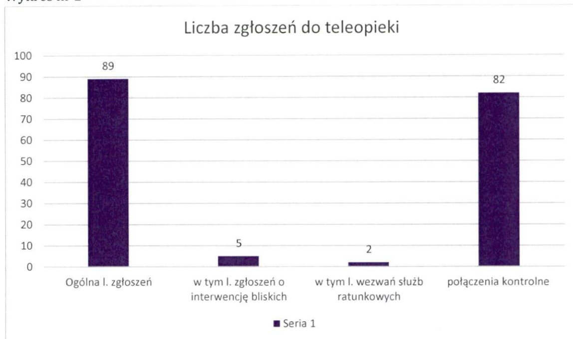
Wykres nr 2